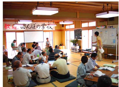
研修会場の講義の様子。 自然体験活動上級指導者による安 全管理の講義など、体験活動に必要 な視点を学べます。