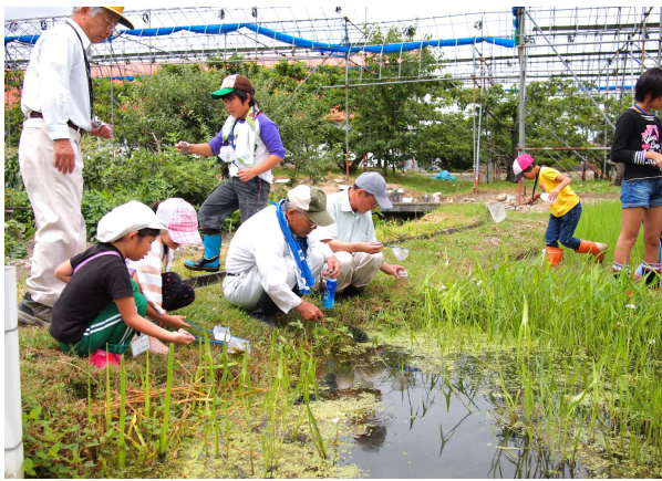
小学校の授業で実施している通年プログラムの1 つ「生き物観察会」を体験できます。

山形県河北町の元泉地域農地・水・環境保全組織の活動の一つで 小学校の授業「自然生活体験クラブ」と連携した「めだかの学校」活動 を題材に、「田んぼの学校」(体験学習)の意義や企画の考え方、活 動の際に必要な視点などを一緒に学ぶ研修です。