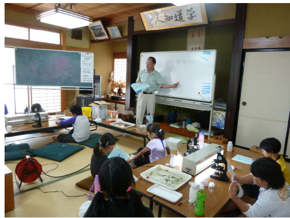
元泉地域では、10年以上続けて自然観察活 動等を実施しています。